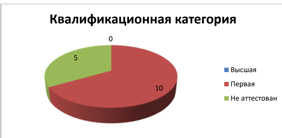
Рис. 2. Диаграмма «Квалификационная категория педагогических работников»